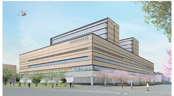
※新病院完成予想図（国道2号からのイメージ）