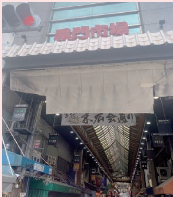
黒門市場（2023年10月29日撮影）

ウ クライナ戦争終結の見通しも立たない最中にイスラエルとパレスチナとの紛争が突如勃発し、世界は今大変不安定な状態にあります。経済面でも多くの国はインフレに苦しみ、高金利政策（日本以外）でインフレ退治に全力で取り組んでいます。そしてようやくこれらの国ではインフレ収束の見通しが立ってきたように思いますが、ただその後にはほぼ確実に不景気（soft or hard landing?）が到来することになると予想されています（コロナ不況の時に世界はあれだけ大盤振る舞いしたのですからある程度の景気後退は致し方ないように思います）。今は政治的にも経済的にも本当に不安な状況で一寸先に何が起こるか分からない世の中です。こんな時こそ確固たる信念と哲学を持ち、先を見据えてぶれずに事に当たることが肝要と思います。