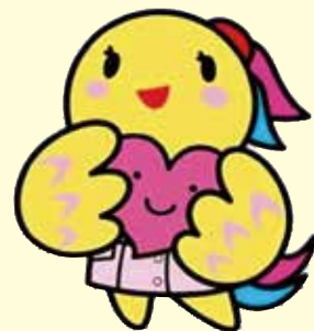
兵庫県立病院 看護師マスコット「あいたん」

ご相談に応じ、共に考え、解決をお手伝いしています。皆様からのご意見は、病院のサービス向上と安全な医療の提供に役立ててまいります。秘密は、厳守しますので、どうぞお気軽にご相談ください。